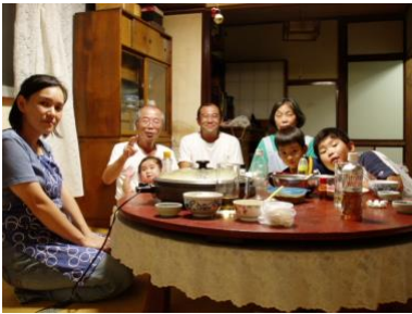
Figure 5. Japanilainen perhe illallisella.

uuteen suuntaan, digitaalista media hyödyntäen. Vuonna 2018 saimme korjata satoa – Venäjällä on hulpeasti suoratoistokäyttäjiä, sekä audio-että visuaalisella puolella (Periscope). Lisäksi 'paikalliset' sosiaaliset alustat kuten VKontakte ja Odnoklassniki ovat suosittuja myös kristillisenä viestintäkanavana.