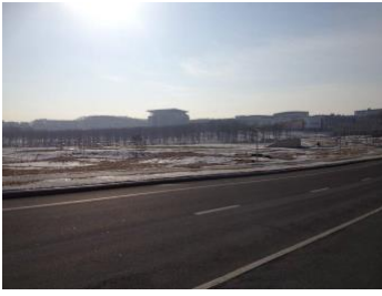
Figure 3. Vladivostok, Venäjän Kauko-Idässä on sosiaalisen median ja suoratoiston kautta saavutettavissa