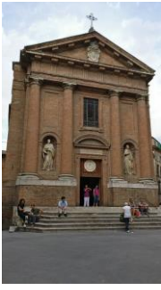
Figure 3. Parasta Italiassa on kirkkojen paljous, johon Aasiassa en ole tottunut. Ihanaa mennä hiljentymään kirkkoon.