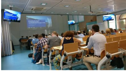
Figure 4 ECREA konferenssissa puhuttiin yleisradioiden tulevaisuudesta ja Podcasteista