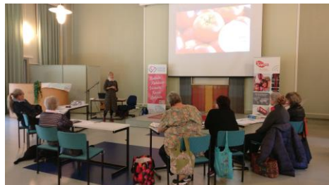
Figure 1 Vivamossa sain tutustua Sansan lähettiläisiin ja kertoa tutkimustyöstä Aasiassa

Syyskuun puolivälissä sain taas tutustua Sansan lähettiläisiin, jotka edustavat paikkakunnillaan Sansaa vapaaehtoisesti joko 'Toivoa Naisille' -työssä tai radiopiireissä. Toivoa Naisille on varsin innokas ja laaja Sansan työmuoto. Se alkoi 20 v. sitten kun Marli Spieker tuli Suomeen kertomaan naisille tarkoitetusta makasiinityyppisestä radio-ohjelmasta, jonka lisänä jaettiin kansainvälistä rukouskalenteria. Jos olet kiinnostunut, voit tilata rukouskalenteria osoitteesta toivoanaisille@sansa.fi tai ladata sen osoitteesta https://sansa.fi/mediat/toivoa-naisille-rukouskalenteri/